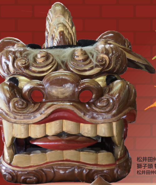
松井田仲町の 獅子頭 牡牝 松井田仲町蔵