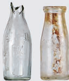
伊勢崎城跡 牛乳瓶