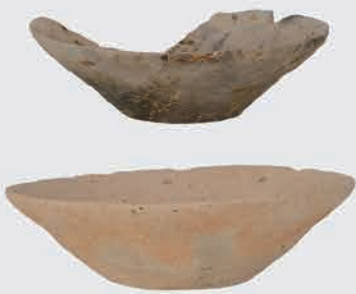
伊勢崎城跡 かわらけ