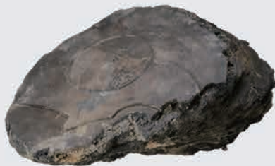
伊勢崎城跡 伊勢崎空襲で焼けたレコード