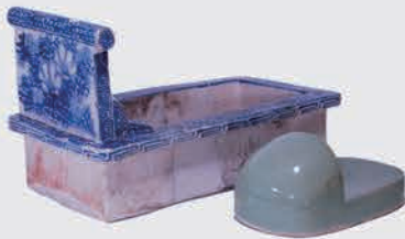
伊勢崎城跡 便器と廁下駄