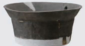
伊勢崎城跡 内耳鍋