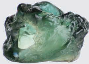
伊勢崎城跡 伊勢崎空襲で溶けたガラス