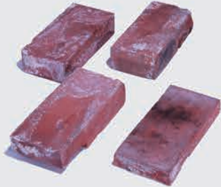
伊勢崎城跡 染色窯に使用されたレンガ