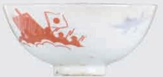
伊勢崎城跡 統制食器