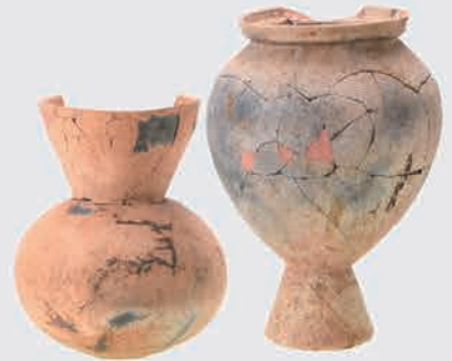
喜多町遺跡 1号・4号周溝墓