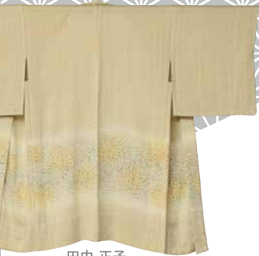
田中 正子 江戸小紋(高崎市)