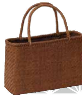
毒島 吉一 つる工芸(伊勢崎市)