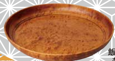
飯出 袈裟市 木工芸(前橋市)