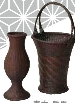
青木 岳男 竹工芸(上野村)