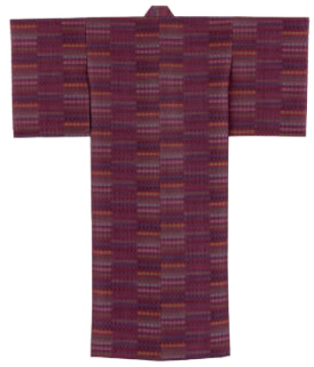
絹紫地緯色緋ヤシラミ花織着物『春霞』