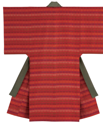
絹赤地五色浮織衣裳