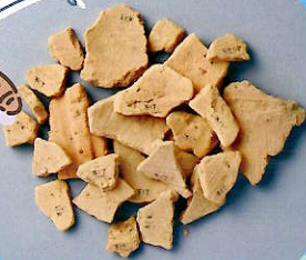
高崎市不動山古墳出土 《円筒埴輪片》