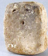
前橋市西新井遺跡出土 《土版》