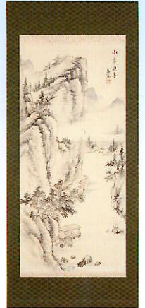
金井烏洲《水亭避暑》