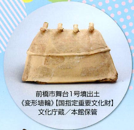
前橋市舞台1号墳出土 《変形埴輪》【国指定重要文化財】 文化庁蔵／本館保管

最近、埴輪がブームになっています。刀剣のブームも続いているようです。でもマニア以外の方にとって、埴輪や刀剣の情報がもう少しあれば、展示資料をさらに一歩踏み込んで見ることや楽しむことができます。本展は今まで興味がなかった時代、または素通りしていた展示コーナーなどに、少しでも興味や関心を持っていただこうと企画しました。展示資料についての素朴な疑問を想定し、目からウロコの見かたを紹介します。ただ観覧するのではなく、自分なりの疑問や好奇心をもって博物館資料を見ていただき、その楽しさをお伝えできればと思っています。またブームに乗って、本館が収蔵する貴重な埴輪も展示します。どうぞお楽しみください。