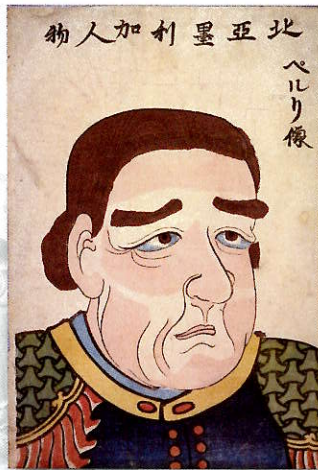
ペリー画像

本展覧会では、「富岡製糸場と絹産業遺産群」の世界遺産登録10周年を記念して、西洋技術導入期の日本の姿を主要な生糸生産地群馬の近代化という視点で見えていきます。