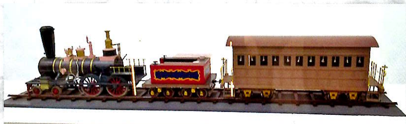
ペリー持参の蒸気車の復元模型(鉄道博物館蔵)