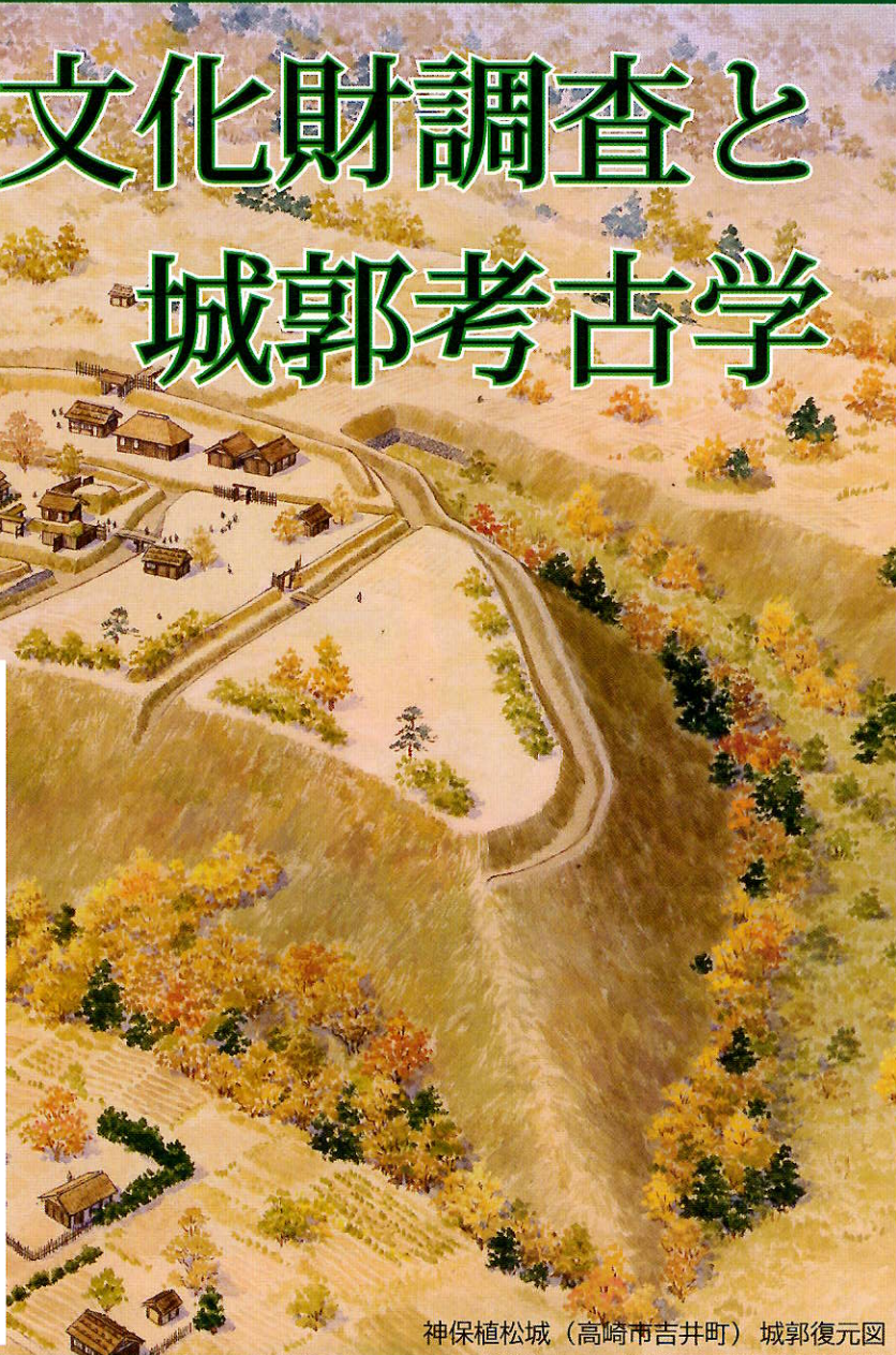
神保植松城 (高崎市吉井町) 城郭復元図