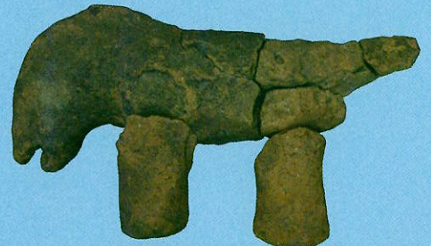
馬形土製品(大室古墳群168号墳/長野市教育委員会蔵)