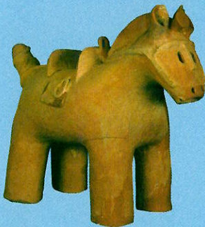
馬形埴輪 (白藤古墳群V-4号墳/前橋市教育委員会蔵)