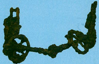
環板埴輪(剣崎長瀬西遺跡13号土坑/高崎市教育委員会蔵)