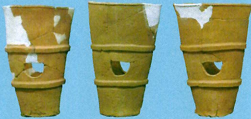
円筒埴輪(剣崎長瀬西遺跡1号墳/高崎市教育委員会蔵)